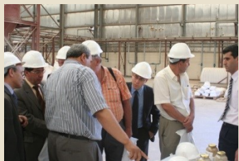
Dans une usine