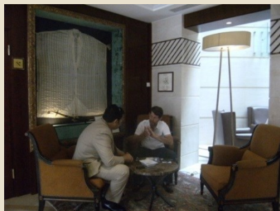
Entretiens personnalisés et bilatéraux