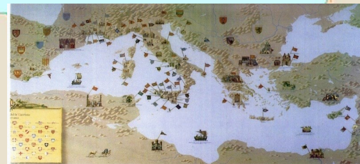
Carte du commerce en méditerranée au XIIe s.