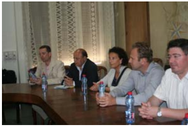
A la Chambre de Commerce